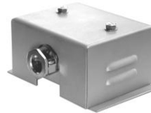
2.4 KAA 3-polig M4 65 x 45 x 85