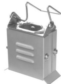
3.8 GAA CEE-ITUK-32 60 x 70 x 40 auch kon. Ausf. (25 breit)