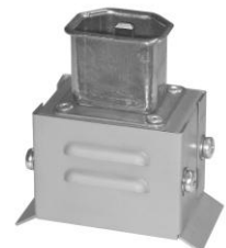
3.7 GAA CEE-ITAK-34 50 x 70 x 40 auch kon. Ausf. (20 breit)