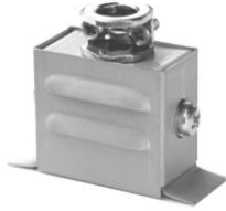
1.2 FAA-K-radial 35 x 35 x 35 1.2 FAA-M-radial 35 x 30 x 25