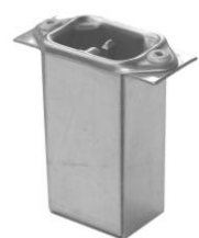
3.11 GAA CEE-16A-HP 35 x 65 x 30

Anschlussarmaturen 11.3.1-11.3.5 sowie 11.3.9 u. 11.3.10 sind nur für den Export zugelassen!