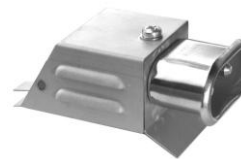
3.4 GAA UFT-ITAK-W-90 80 x 35 x 50