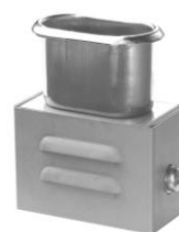
3.10 GAA UFT-ITAK-25-HP 50 x 65 x 30 -FRHK