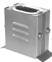
3.9 GAA UFT-ITUK-32 65 x 65 x 40