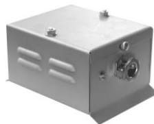
2.8 KAA für 2 CN-Aufreihklemmen 100 x 45 x 65* *je Kl.-Erw. +21 mm