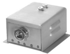
2.2 KAA 2-pol. M4 50 x 40 x 65 2.2 KAA 2-pol. M5 65 x 40 x 75 Winkel auch um 90° versetzt