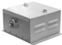
2.7 KAA 3-polig M5 85 x 50 x 95 Winkel auch um 90° versetzt