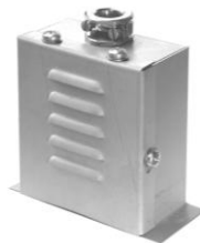
2.3 KAA 2-pol. M4 55 x 65 x 35 2.3 KAA 2-pol. M5 70 x 80 x 40 auch kon. Ausf. (22 breit)