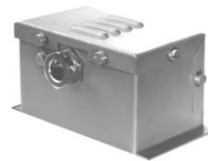
2.9 KAA für 2 CN-Aufreihklemmen 105 x 60 x 65* *je Kl.-Erw. +21 mm