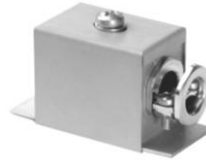
1.3 FAA-K-tangential 40 x 35 x 35 1.3 FAA-M-tangential 35 x 30 x 25