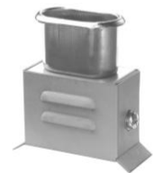
3.1 GAA UFT-ITAK-20 45 x 65 x 25