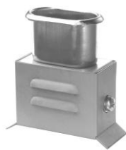
3.2 GAA UFT-ITAK-25 50 x 65 x 30