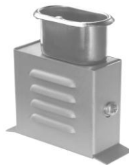
3.3 GAA UFT-ITAK-22-RP 55 x 85 x 25 -RHK