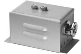
2.1 KAA 2-pol. M4 50 x 40 x 50 2.1 KAA 2-pol. M5 75 x 40 x 55